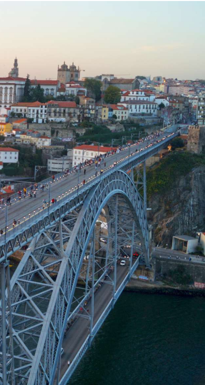
Porto's beroemdste brug over de Douro is de ijzeren Luis I-brug.