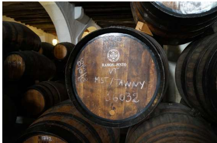
Honderd jaar oude vaten leveren prima portwijn af bij Ramos Pinto.