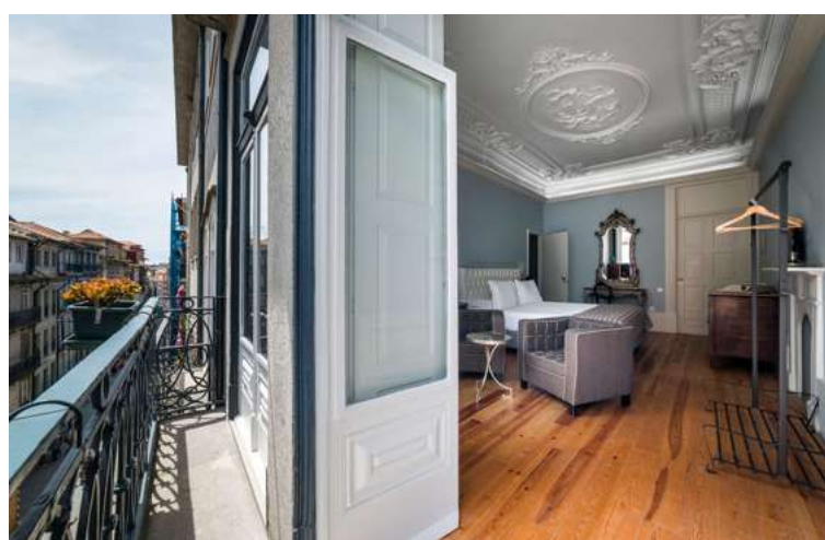
De ruime 'deluxe double', met zithoek en balkonnetje.

Boeken kan via www.shiadu.com . Voor een Deluxe Double betaalden wij 102 euro per nacht, copieus ontbijt inbegrepen.