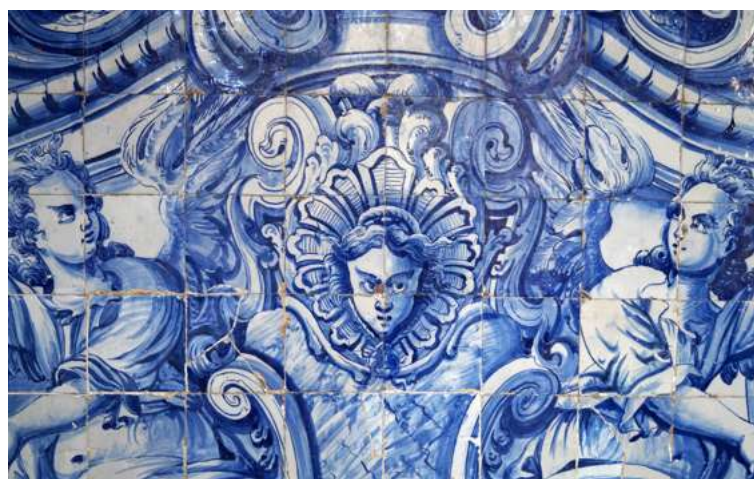
Struinen door de stad is oog in oog staan met kunstige azulejos.