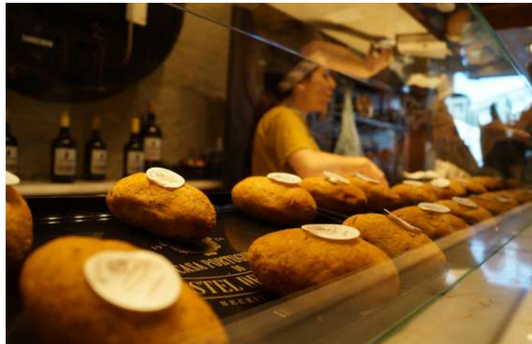
Een lokale specialiteit die je moet proeven: 'pastel de bacalhau'.